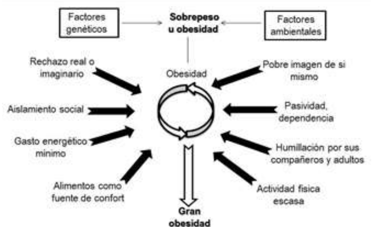
Figura 4. Factores del sobrepeso y la obesidad.

ello tributaría al plan de acción en el análisis de la situación de salud en el municipio.