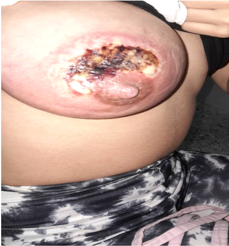
Figura 1. Se muestra absceso de la mama con necrosis del área