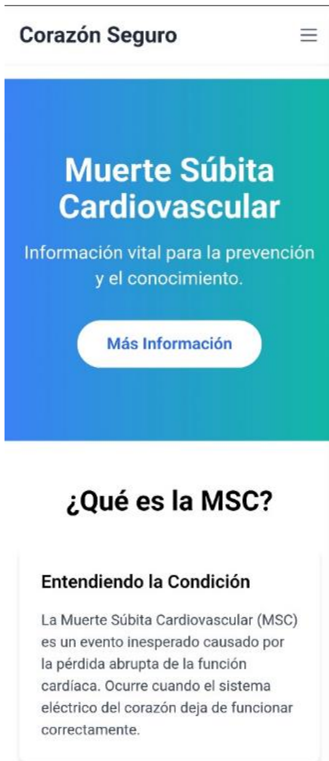
Figura 1. Vista de inicio del sitio.

La sección de recursos digitales almacena artículos ( figura 2 ), guías y enlaces categorizados por temática (epidemiología, diagnóstico, genética, prevención, dispositivos, rehabilitación). Los recursos pueden filtrarse por año, tipo y nivel de evidencia.